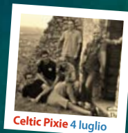
Celtic Pixie 4 luglio