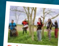
Cisalpipers 24 luglio