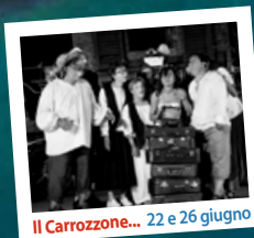
Il Carrozzone... 22 e 26 giugno