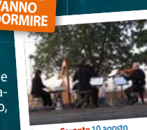
Gruppo Caronte 10 agosto