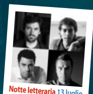
Notte letteraria 13 luglio

Domenica 22 luglio ore 5.30 del mattino Anfo Rocca d'Anfo Verdecane in concerto